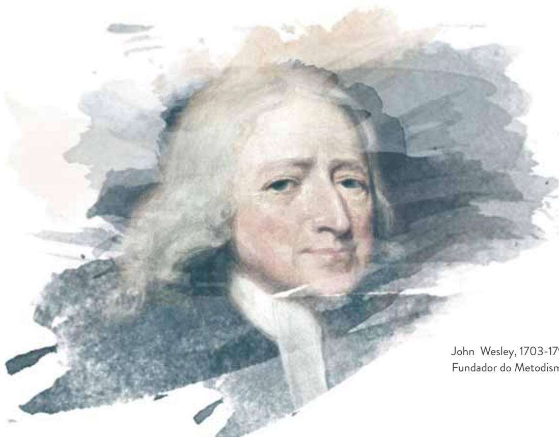
John Wesley, 1703-1791 Fundador do Metodismo