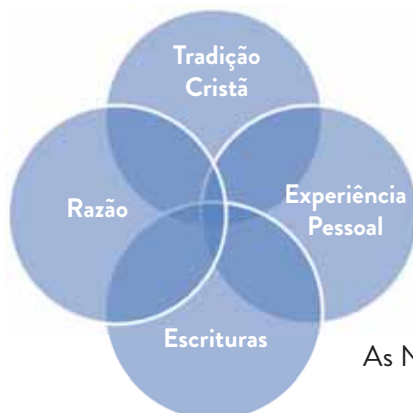
As Nossas fontes de coerência teológica